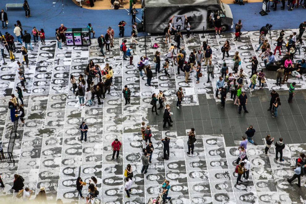
Inside Out Project (seit 2011)