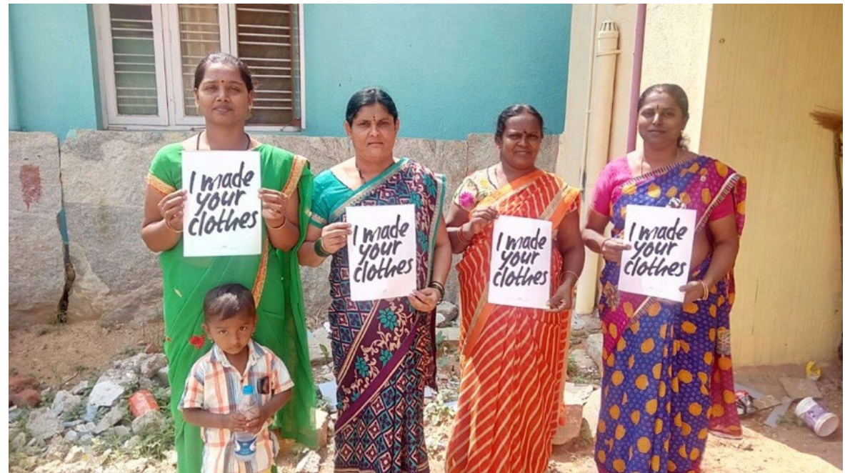
Who Made My Clothes (seit 2014)