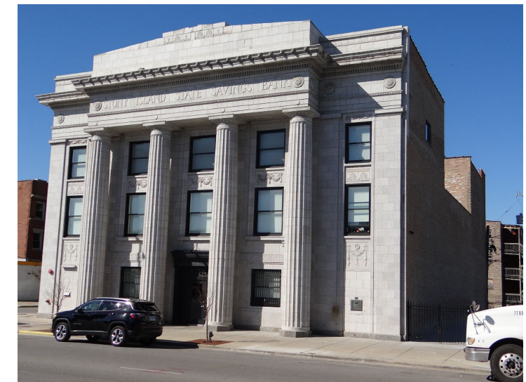
Stony Island Arts Bank (seit 2013)

“ Culture makes us human. It is how we create trust, wonder, faith, belonging. Culture helps us care for one another and for the world we share. It reminds us that nature is part of our humanity and that it contains an imagination greater than our own.”